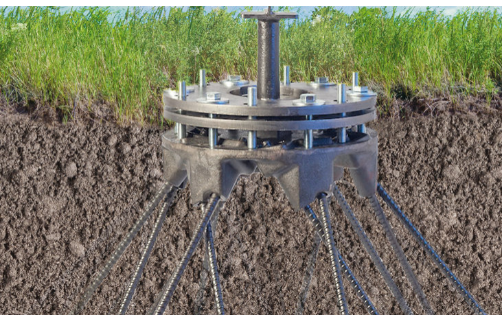
Betonlose, flexible Fundamente