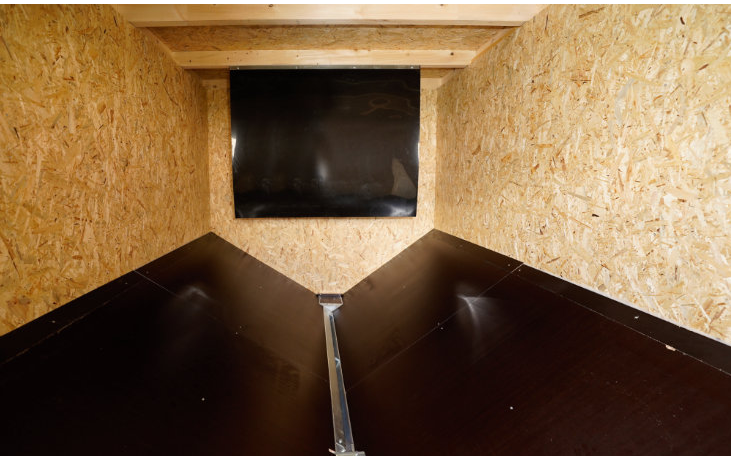
Innenraumgestaltung mit Schrägboden