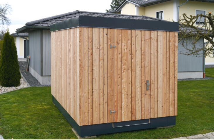
Brennstoff Lager als Nebengebäude